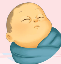
Baby with jaundice